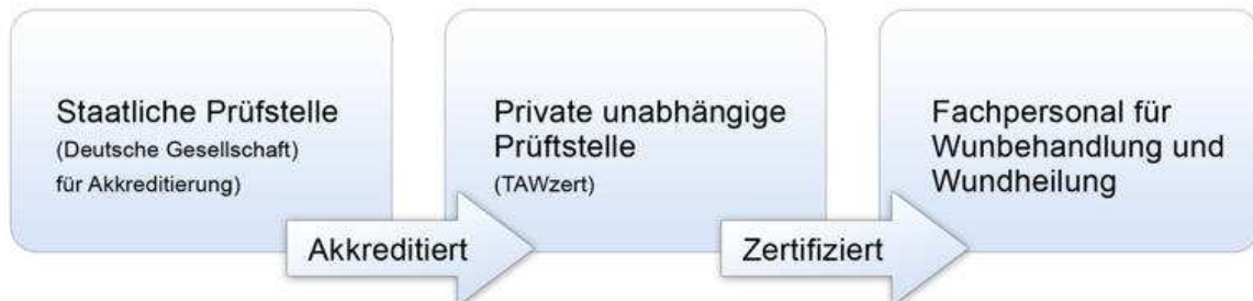
Abb. 1: Organisationsstrukturen DGA und Zertifizierungsstellen